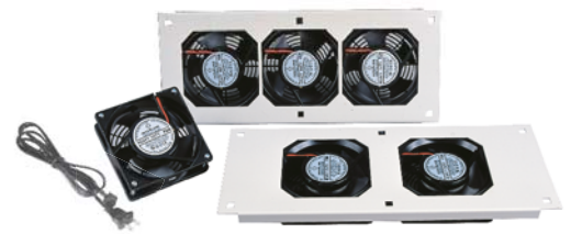
(2 Ball Bearing Heavy Duty Type)