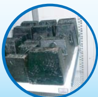
การทดสอบความสามารถในการรับน้ำหนัก