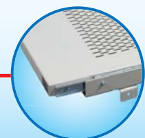
ถาดสไลด์อยู่ในรางเลื่อนชนิดลูกปืน